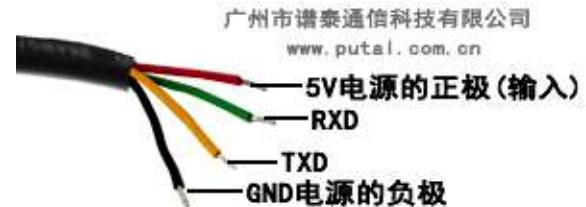
PTC02B-300 TTL 通讯接口定义图