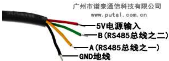
PTC02A-300 RS485 通讯接口定义图